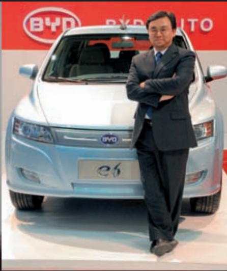
22 BYD-Chairman Chuanfu Wang mit dem E6: Künftig Weltmarktführer in Sachen E-Mobilität?