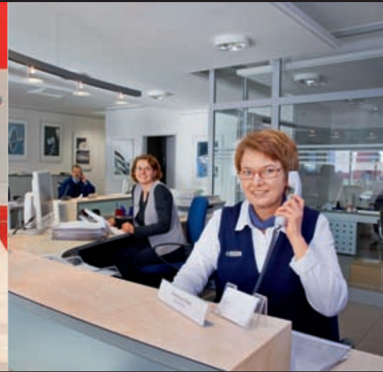
66 Mercedes-Benz Niederlassung Rostock: Prozesse im Service verbessert und so die Kundenzufriedenheit weiter gesteigert.