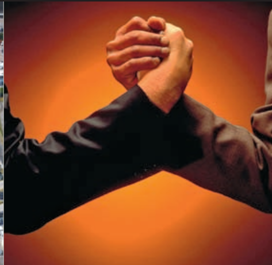
50 Kräftemessen: Innungsmitgliedschaft ohne Tarifbindung? Bundesarbeitsgericht kontra Verwaltungsgericht.