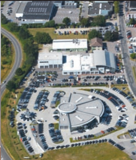
24 AZF Unternehmensgruppe: Das Flensburger Autohaus belegte den 2. Platz im Wettbewerb „Der beste GW-Platz 2010.“