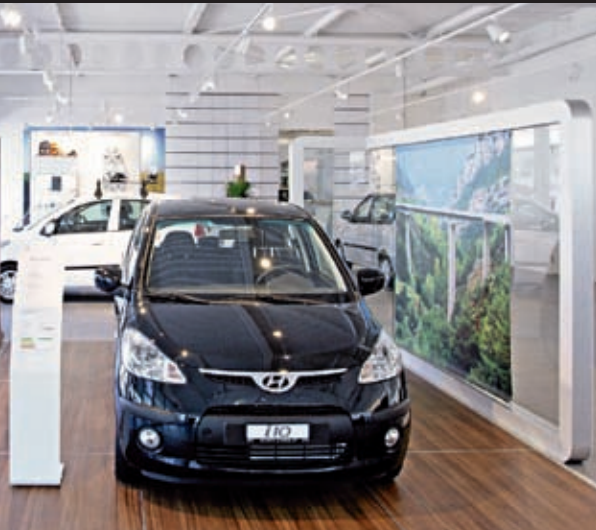
28 Hyundai: Ein Marken-Relaunch soll Hyunda höherpositionieren. Auch die Showrooms sind Teil der Strategie.