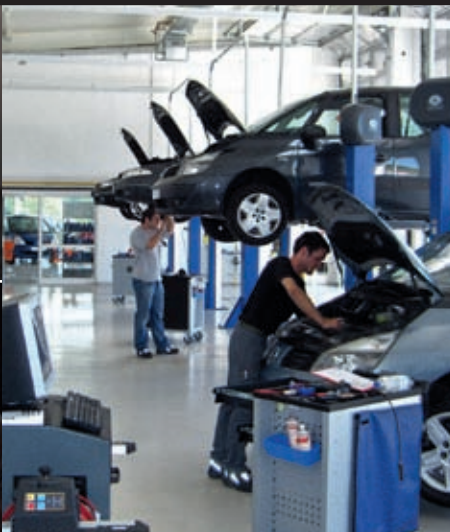
46 Theopraktiker-Konzept: Service ohne Serviceberater – eine wissenschaftliche 3-Jahres-Bilanz.