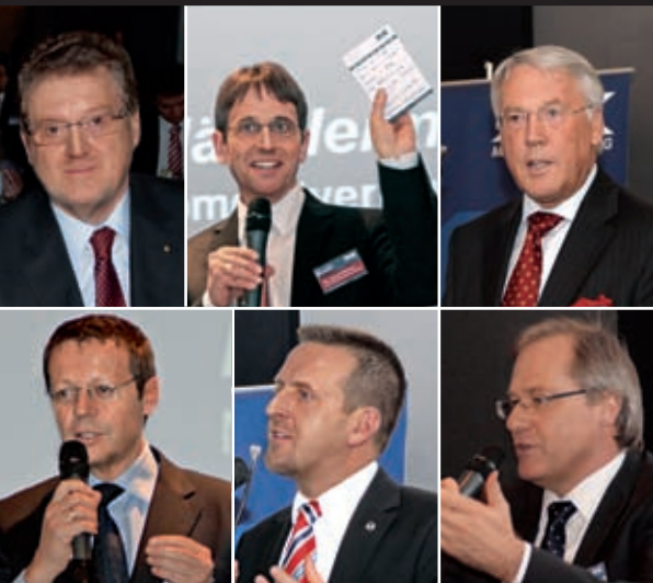
22 Sechster puls Automobilkongress: Ein aktueller Fokus auf das Spannungsfeld Herstellermarke versus Händlermarke