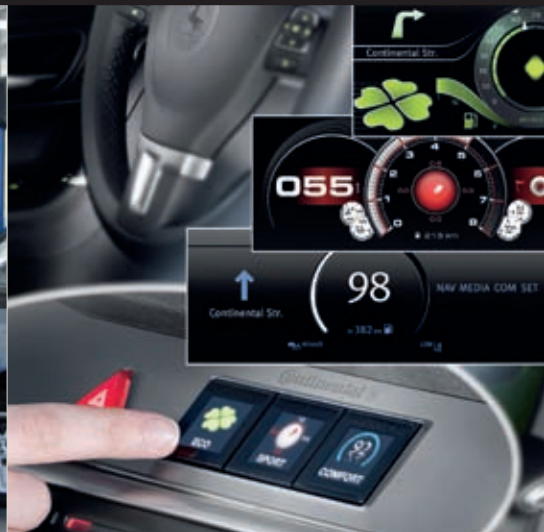
74 Fahrzeugintelligenz: Bessere Mensch-Maschine-Schnittstellen für ein besseres Zusammenspiel von Auto und Fahrer.