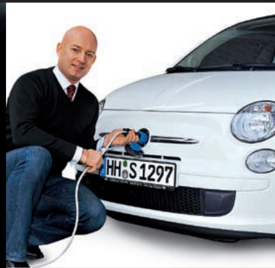
32 E-Mobilität: Der Fiat-Professional-Händler Karabag importiert und entwickelt E-Autos der italienischen Firma Micro-Vett.