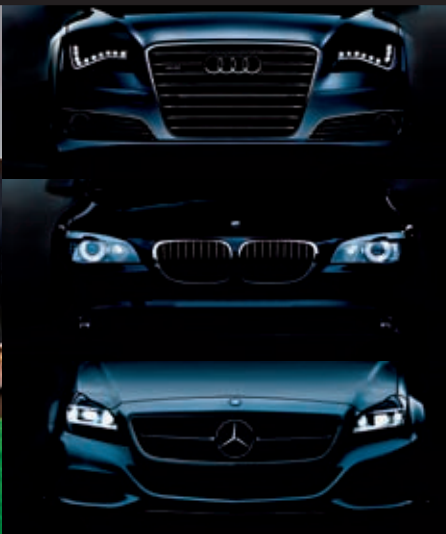
20 Premium-Vergleich: Im Wettbewerb um die Führung im Premiumsegment werden die Karten derzeit neu gemischt.