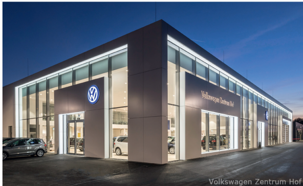
Volkswagen Zentrum Hof